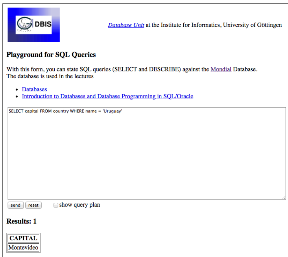
FIGURE 3 – L'interface client de la BDR MONDIAL .

Considérons à titre d'exemple la base de données MONDIAL que nous allons utiliser pour illustrer ce cours. Il s'agit d'une BDR qui compile un certain nombre de données géographiques et qui est gérée par l'université de Göttingen. Il est possible d'interagir avec elle en utilisant un formulaire que l'on trouve à l'adresse : http://www.semwebtech.org/sqlfrontend/