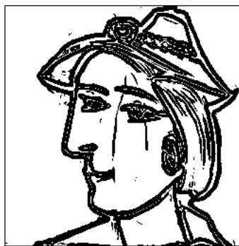
FIGURE 3 – La détection des contours de l'image test. Un lissage a d'abord été appliqué pour réduire le bruit.

def contour(im, seuil): n, p, _ = im.shape im_lum = niveaudegris(im) gr = gradient(im_lum) im_c = np.zeros_like(im_lum) for i in range(n): for j in range(p): if gr[i, j] < seuil: im_c[i, j] = 255 return im_c