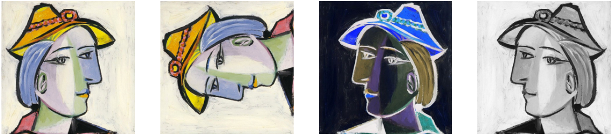
FIGURE 1 – Le résultat des quatre fonctions ci-dessus sur l’image test.